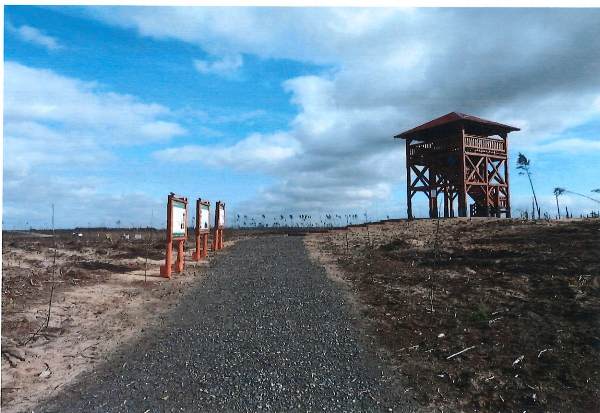
Na zdjęciu: Wieża widokowa w Leśnictwie Młynki na terenie pokłęskowym służy edukacji leśnej społeczeństwa.

W 2018 roku pobudowano wieżę widokową usytuowaną przy drodze krajowej nr 22 koło miejscowości Rytel, gdzie można zobaczyć rozległy widok na obszar pokłęskowy, który uzmysławia skalę zniszczeń i ogrom pracy do wykonania przy sadzeniu nowego pokolenia lasu.